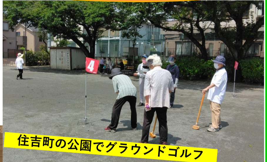
住吉町の公園でグラウンドゴルフ

戦後まもなく誕生した「老人クラブ」の目的は、 高齢期の幸せを高齢者自身の手で創り出す ことでした。思いは広がり、やがて全国組織に。昨年、全国老人クラブ連合会は、創立60周年を迎え、「仲間づくり」によって、健康づくり、ささえあいづくり、生きがいづくり、地域づくりにつながる取り組みが多彩におこなわれています。