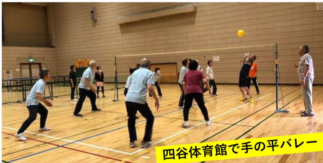
四谷体育館で手の平バレー

府中市では、老人クラブを「シニアクラブ」と名称を変え、各地域で自主的な活動展開をしています。概ね60才以上の市民の方なら、どなたでもいつからでも入会できます。地域包括支援センターよつや苑としても、 介護予防、フレイル予防の活動として応援し、地域共生社会の実現に大きな役割を果たしてくださいと期待しています。