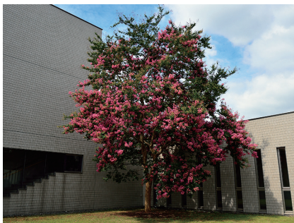
こまえ正吉苑（狛江市）