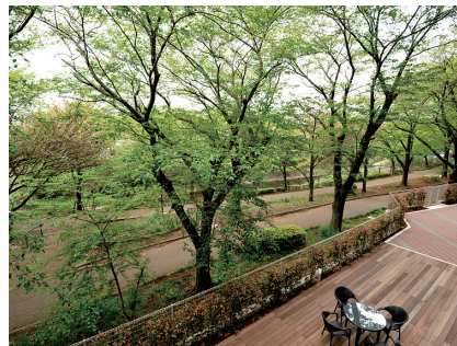
まちだ正吉苑（町田市）