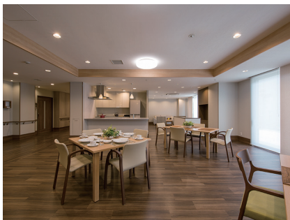
こまえ正吉苑 二番館（狛江市）