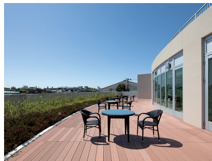
杜の風・上原（渋谷区）