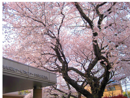
すぎなみ正吉苑（杉並区）