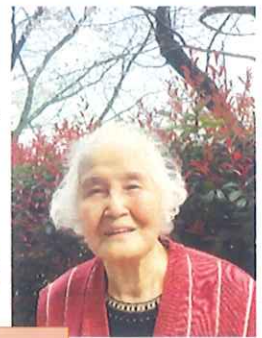
開花予想的中しました！