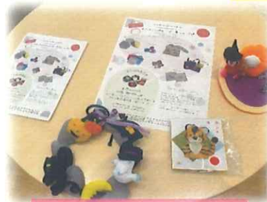
モノづくりメンバー 募集中です！！