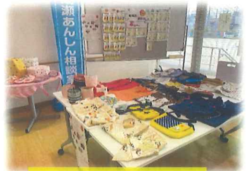
～モノづくりブース～

この2年間コロナ禍で多くのイベントが中止されてきましたが、今年度は成瀬コミュニティセンター運営委員会と高ヶ坂・成瀬地区協議会の合同イベントとして3/26、3/27に「高ヶ坂・成瀬フェスタ2021」が無事に開催されました。都立小川高校・成瀬高校の吹奏楽部の演奏をはじめ、成瀬囃子連、響鼓(和太鼓)、等のプログラムによって構成され、終始賑やかなイベントとなりました。南第3高齢者支援センターでは①あんしんキーホルダーの登録会と②地域住民のボランティア団体【ものづくりグループ】による展示品のバザーを出店いたしました。