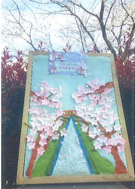
今年は移動式の予想ボード

東京の開花より数日遅れの3月24日に正吉苑の標準木は開花しました。 今年は7名様が見事開花の予想を的中されました。その内のおひとりは昨年今年と2年 連続の予想的中でした！！開花後はウッドデッキテラスや恩田川沿いにて、桜の絶景を 堪能いただきました。