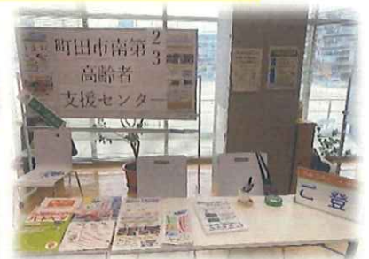
あんしんキーホルダー登録会